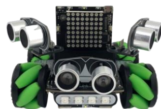
探索號-麥輪車型態